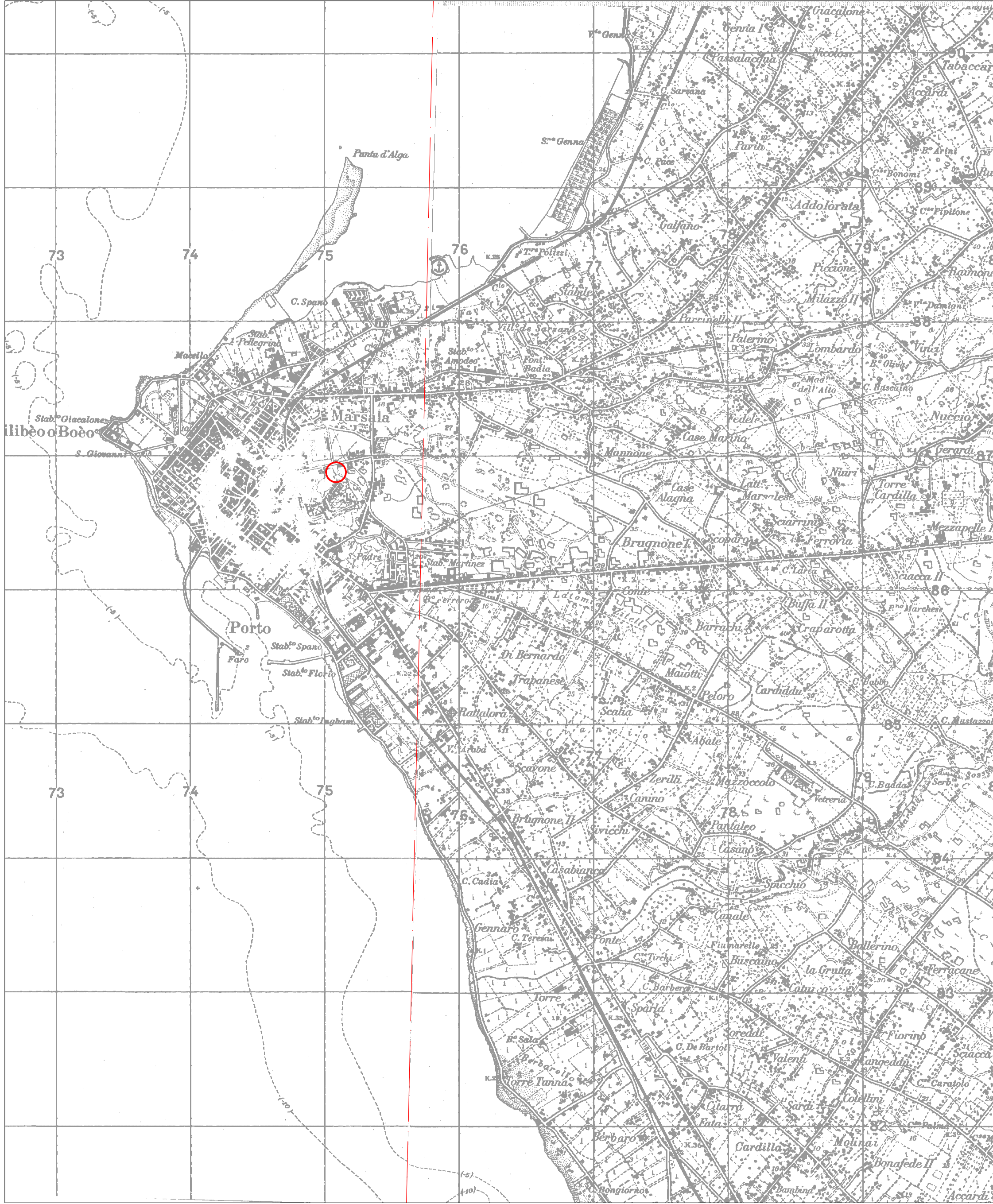
STRALCIO I.G.M. FOGLIO N° 256 II NE - MARSALA - N° 257 III NO - PAOLINI -

SCALA 1:25.000 0 m 250 500 m 1000 m 1500 m 2000 m