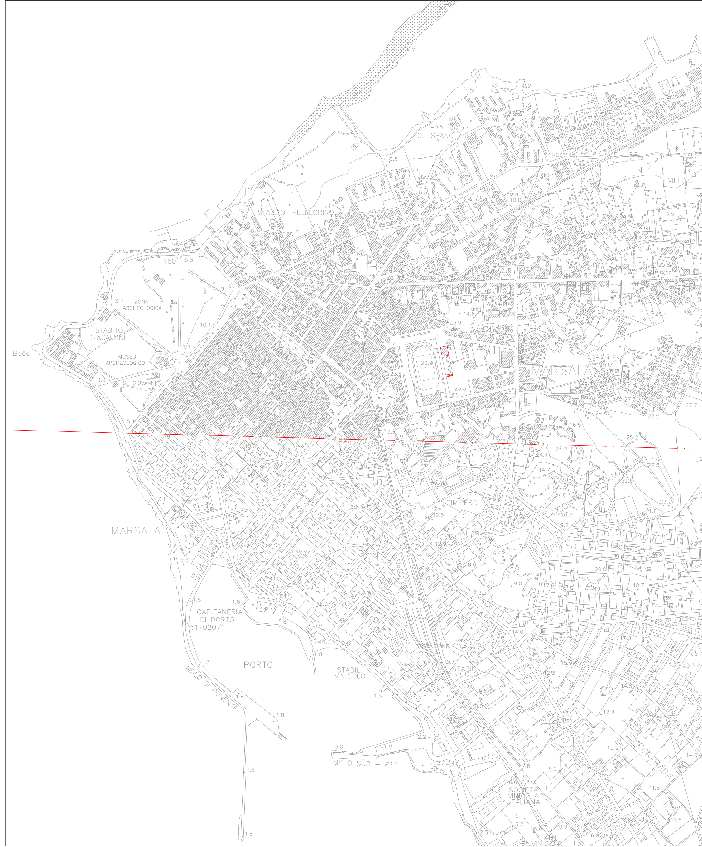
STRALCIO CTR FOGLIO N° 605140 - N° 617020

SCALA 1:25.000 0 m 250 500 m 1000 m 1500 m 2000 m